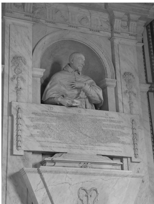
Abb. 7 Alessandro Algardi, Grabmal Giovanni Garzia Mellinis, Detail, Rom, S. Maria del Popolo

richtet wurden, immer in Rechnung zu stellen. In den Familienkapellen sind sie ohnehin Programm. Auch hier ließen sich verschiedene Varianten unterscheiden: etwa die organisch gewachsene Kapelle, in der die Angehörigen der Familie nach und nach versammelt werden, oder die Kapelle aus einem Guss, deren Neugestaltung künstlerisch zwar meist auf der Höhe der Zeit ist, Bestattungen für die Zukunft aber eher erschwert. Man könnte aber auch anders differenzieren, nämlich nach Kapellen, in denen der Sekretär in den Dienst der Familie genommen wird, und solchen, in denen die Familie im Dienst des Sekretärs steht. Das Musterbeispiel für eine solche, auf eine Person bezogene Grabkapelle ist ganz sicher die Cappella Cibo in Santa Maria del Popolo. Nicht nur, dass der Kardinalstaatssekretär Alderano Cibo sein Grab schon zu Lebzeiten entwerfen ließ, und das von einem so berühmten Künstler wie Carlo Fontana. Cibo signalisierte auch mit der Auswahl der mit ihm hier bestatteten Familienmitglieder, worum es ihm ging. Mit in die Kapelle durfte nämlich nur ein einziger Vorfahre, nicht zufällig jener Lorenzo Cibo, der um 1500 selbst Kardinal und überdies ein Neffe von Papst Innozenz VIII. Cibo (1484–1492) war. 34 Der Rest der Verwandtschaft fiel den Umbaumaßnahmen zum