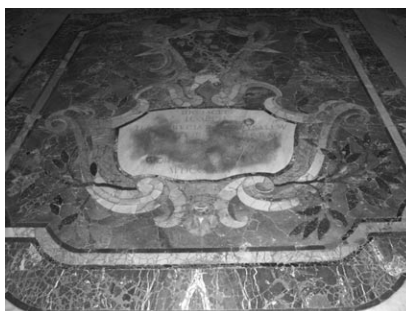
Abb. 3 Rom, Santa Croce in Gerusalemme, Bodenplatte Giuseppe Firraos