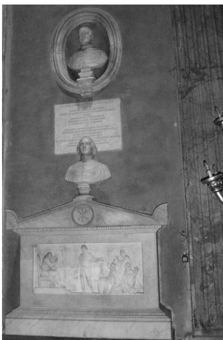
Abb. 1 Rom, Pantheon, Grabmal Ercole Consalvis